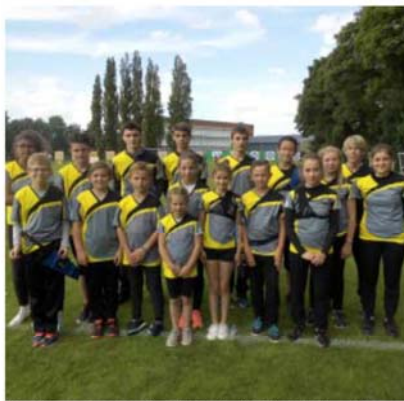
Dix-sept jeunes des archers réunis de Monchy - Bienvilliers étaient en déplacement à Saint-Pol.

Ils étaient en effet dix-sept à faire le court déplacement de Saint-Pol, dont cinq nouveaux archers qui découvraient, pour la première fois, une compétition officielle. « Ils sont la future relève du club, celle qui doit nous permettre de garder le label ETAF (école de tir à l'arc français), et nous espérons que cette découverte de la competi-