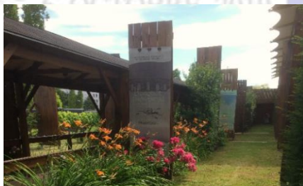
Vue du jeu d'arc de la Compagnie de Pontoise

La répartition des tireurs sera consultable sur notre site www.arcpontoise.fr dès que possible.