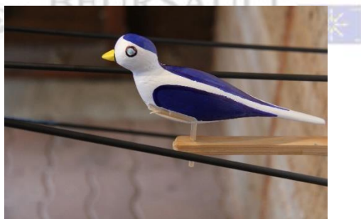
Tir « L'Abat l'Oiseau » 2019, sculpté par J-P. BOUFFON

Merci à vous tous de soutenir cette démarche