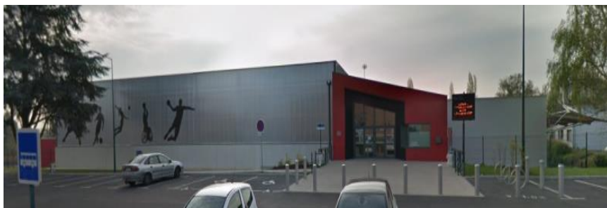
Entrée Hall Omnisport Philippe Hémet

1 rue Pierre de Coubertin 95300 Pontoise cf. plan page suivante