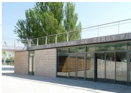
Office de Tourisme de Pontoise

Place de la piscine 95300 Pontoise 01 34 41 70 60